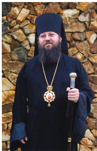
Преосвященнейший Епископ Лондонский и Западно-Европейский Ириней (Стинберг Мэтью Крейг)

Управляющий епархией Преосвященнейший Епископ Лондонский и Западно-Европейский Ириней (Стинберг Мэтью Крейг).