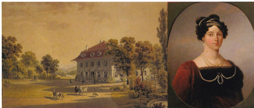
Эльфенау, Берн 1838