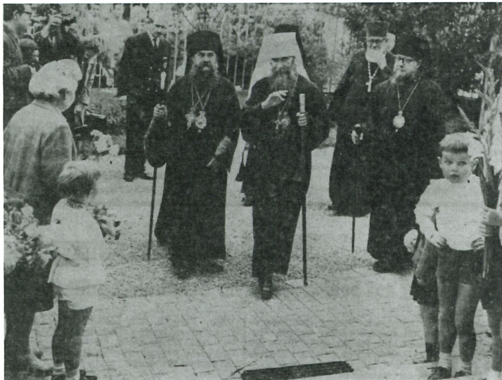
Визит Митрополита Филарета, Первоиерарха РПЦЗ в Берн 1965

Ещё одной такой датой стало 27 сентября 1965 г., когда Первоиерарх РПЦЗ Митрополит Филарет (Вознесенский) после торжественного богослужения в Крестовоздвиженском соборе Женевы, вечером того же дня прибыл в бернский приход, сопровождая Курскую Коренную икону Божией Матери. Перед иконой был отслужен молебен, собравший большое количество верующих. 14